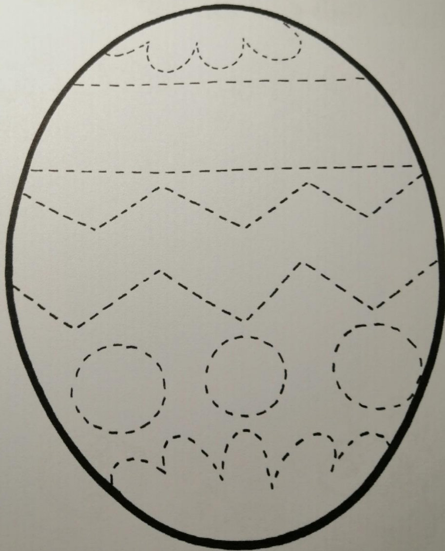
Załącznik nr 7