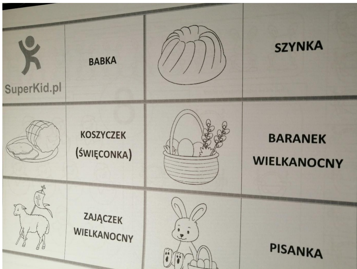
Załącznik nr 11