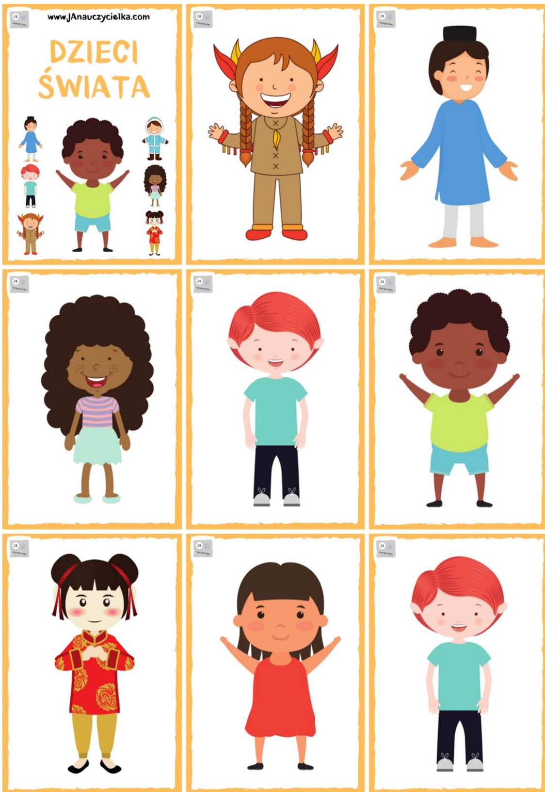
Zadanie nr 1