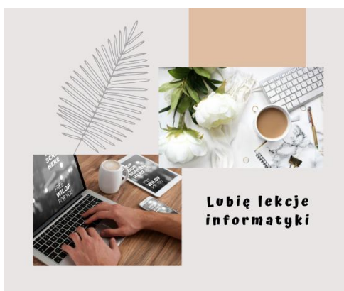
Mala próba tego, co można stworzyć w Canva

Pamiętajcie, że Wasze prace są oceniane. Brak przesłanej pracy powoduje, że nie mam możliwości Was ocenić. Przypominam adres mailowy, na który należy przesyłać wykonane zadania: zss4korczak@gmail.com