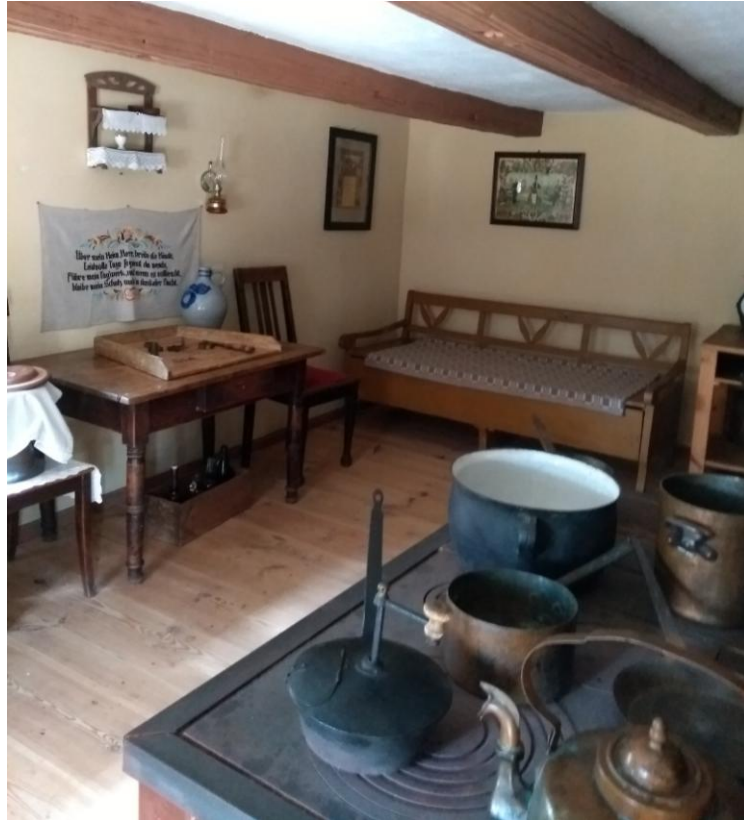
Kuchnia z piecem węglowym