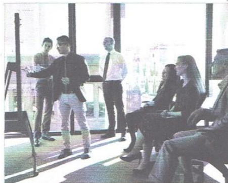
Współcześnie dofinansowanie od aniołów biznesu zdobywa się najczęściej podczas specjalnie organizowanych sesji prezentacji przedsięwzięć.

By przekonać do inwestycji aniołów biznesu, start-upowcy często muszą przedstawić im prezentację swojego pomysłu. Określa się ją jako „piczowanie” (ang. pitch – zdobywać). Jest to słowo pochodzące od elevator pitch , czyli krótkiej prezentacji w windzie. Wzięło się stąd, że młodzi ludzie próbowali porozmawiać z dużymi przedsiębiorcami, ale zdawali sobie sprawę z ich braku czasu. Dlatego podczas jednej jazdy windą w biurowcu starali się przekonać inwestorów do wsparcia swojego pomysłu lub choćby umówienia się na spotkanie.