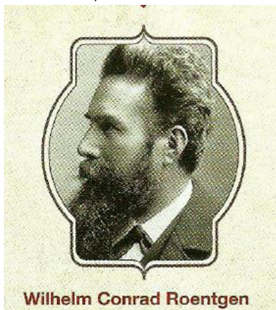
Wilhelm Conrad Roentgen