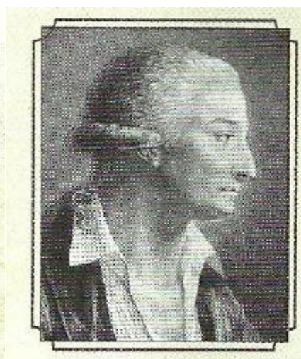
Antoine Laurent de Lavoisier (1743–1794)