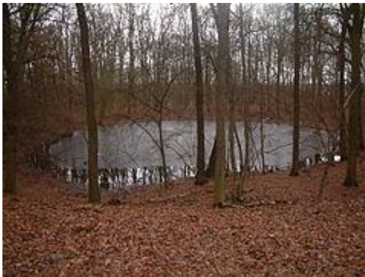
Jeden z kraterów w rezerwacie

Meteoryt Morasko – krajobrazowo-leśny rezerwat przyrody utworzony 24 maja 1976 roku, położony w północnej części Poznania. Na jego terenie mieszczą się kratery, które zdaniem większości badaczy powstały w wyniku upadku meteorytu Morasko ok. 5 tys. lat temu.