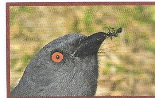
SĄ POŻYWIENIEM DLA PTAKÓW.

KORNIK JEST SZKODNIKIEM LASÓW, PONIEWAŻ: