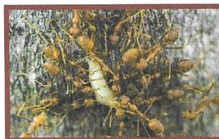
ZJADAJĄ SZKODNIKI LASU.