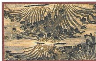
ZJADA DREWNO. NISZCZY LAS.

KORNIK JEST SZKODNIKIEM LASÓW, PONIEWAŻ: